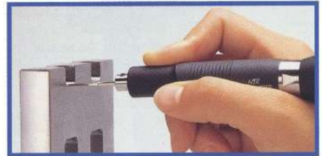
■ MINI LUSTER ML-8 Crayon Alternatif