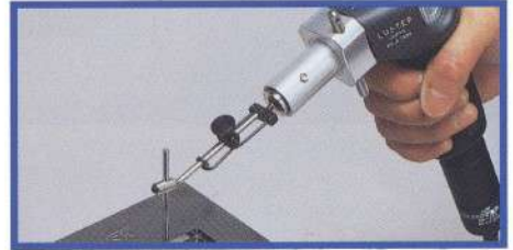
■ LS-100 Poignée à Mouvement Alternatif