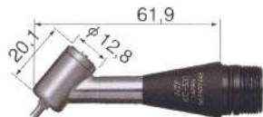
■ KC-300 Renvoi D'angle à 45°