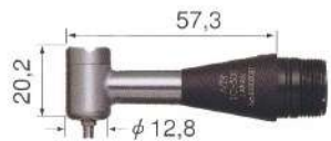
■ IC-300 Renvoi D'angle à 90°