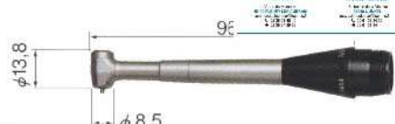
■ MFC-300S Renvoi D'angle Pour Chanfreiner dans des alésages