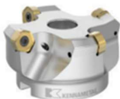
Dodeka Mini 45° Dodeka 45°

Validité de l'offre : du 1 er Janvier au 30 Avril 2023